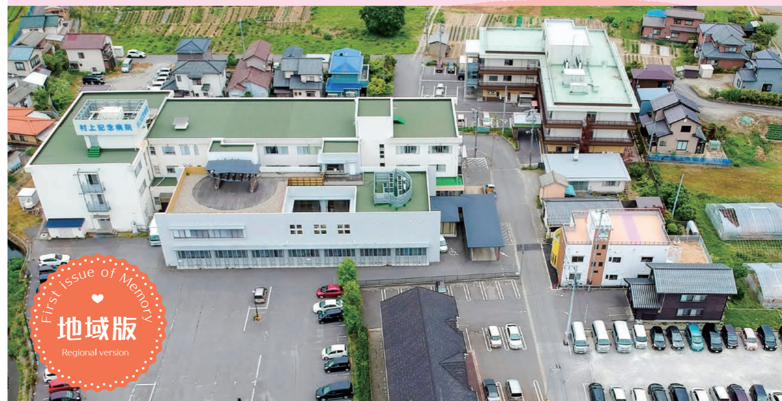
村上記念病院 外観:ドローン撮影 事務長 黒坂 2020年6月1日